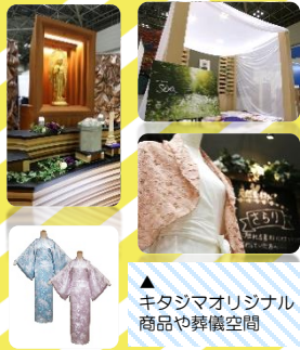
▲キタジマオリジナル商品や葬儀空間