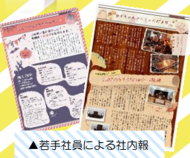
▲若手社員による社内報

■今後のビジョンは？ キタジマスピリッツ「葬儀礼を重んじつつ、常に時代にあわせた商品提案。世の中になければキタジマがつくる！」創業者の精神や経験を次世代に受け継ぐこと。そして、若手社員が増えてきた今、わかりやすい教育や評価の構築。若手社員は発想が豊かで時代の変化に必要な力です。また、時代の変化に対応しながら、キタジマの商品を直接エンドユーザーに訴えかける仕組みづくりを考えていきたいと思っています。 社長の決断の一つは、未来を決めます。 創業五〇周年まで、あと五年。楽しみにしててください。