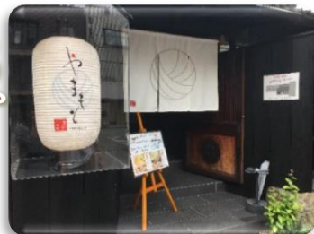
やまもとカレーうどん